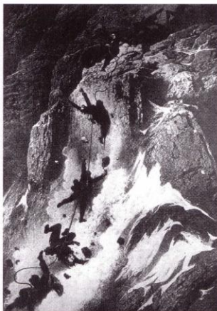
The artist Gustave Doré illustrated the tragedy on the Matterhorn.

More than 150 years ago, the Swiss Alps were a wild and deserted region. There were no skiers on the slopes, no hikers in the hills and no alpinists who climbed the snowy peaks. The farmers who lived in the villages under the mountains never dreamed of climbing up to the top just for the fun of looking down.